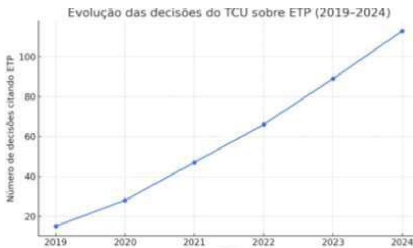
Gráfico 1 – Evolução das decisões do TCU sobre ETP (2019–2024)