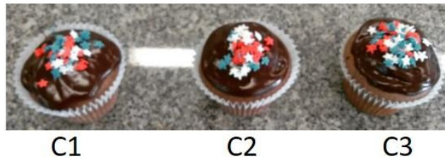
Figura 3: Apresentação visual final das amostras de cupcakes (C1, C2 e C3)