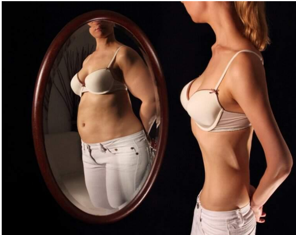
Figura 2: Distorção de imagem em paciente com anorexia